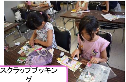
スクラップブッキング