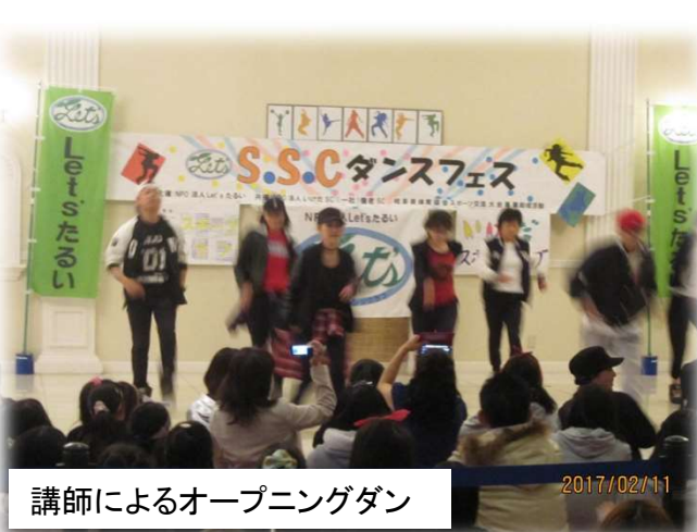
講師によるオープニングダン

今回のイベントでは、会場、進行役と、メモリアグループの社員の方々、抽選会ではスポーツオーソリティさんからの物品提供などと、大変ご協力を頂きました。みな様、本当にありがとうございました。