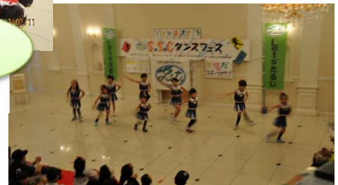
先頭バッター、キッズビクスリトル