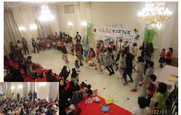
会場はいっぱいの人です