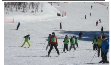
先生に続いて滑ったよ！