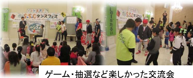
ゲーム・抽選など楽しかった交流会