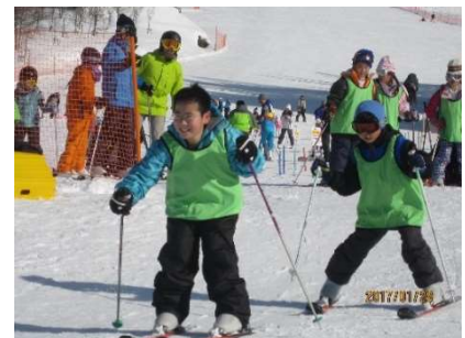
「ハの字」で踏ん張って