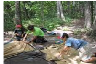
今夜のお泊り・テント設営、わくわくします☆