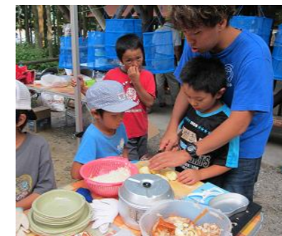
夕食カレー作り・野菜の切り方を教えてもらいました