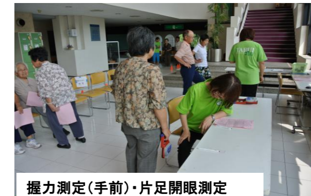
握力測定(手前)・片足開眼測定

9月11日・12日2日間、町文化会館で60歳以上の方を対象とした「体力測定会」を実施しました。この事業は、垂井町健康福祉課の委託事業で、「要支援・要介護の予防として自分の体力を知るきっかけ」として行なっています。260名の方が測定されましたが、参加者から「昨年よりいい結果だった」「今年は全然運動してないから、数値がすごく下がった」など、現状を知っていただく機会になりました。昨年受けた方は、昨年のご自分のデータと比較することもできました。