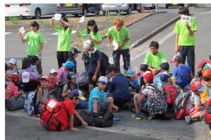
班ごとに整列・いよいよ出発!