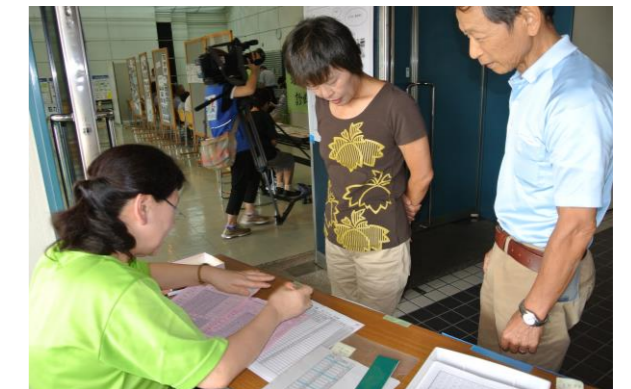
今回は、ご夫婦・親子の参加も多く見られました