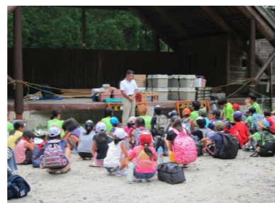
キャンプ場に到着・入所式 オリエンテーション