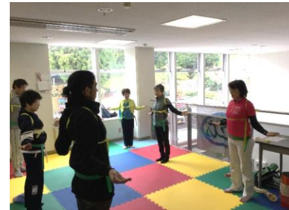
からだリセット ほぐす・のばす・整えるで、骨格を中心に体を整えます