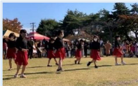
KIDS JAZZ DANCE A