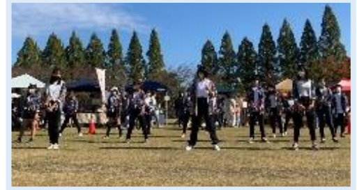
KIDS JAZZ DANCE B