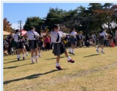
キッズビクスダンス