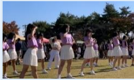
K-POP DANCE A・B