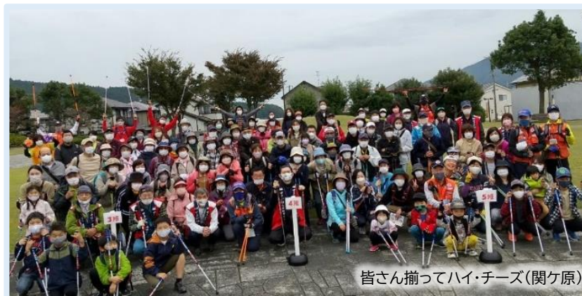
皆さん揃ってハイ・チーズ(関ヶ原)