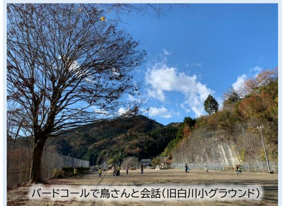
バードコールで鳥さんと会話(旧白川小グラウンド)