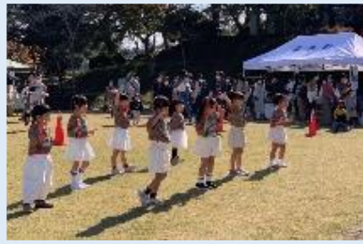
リトルキッズダンス